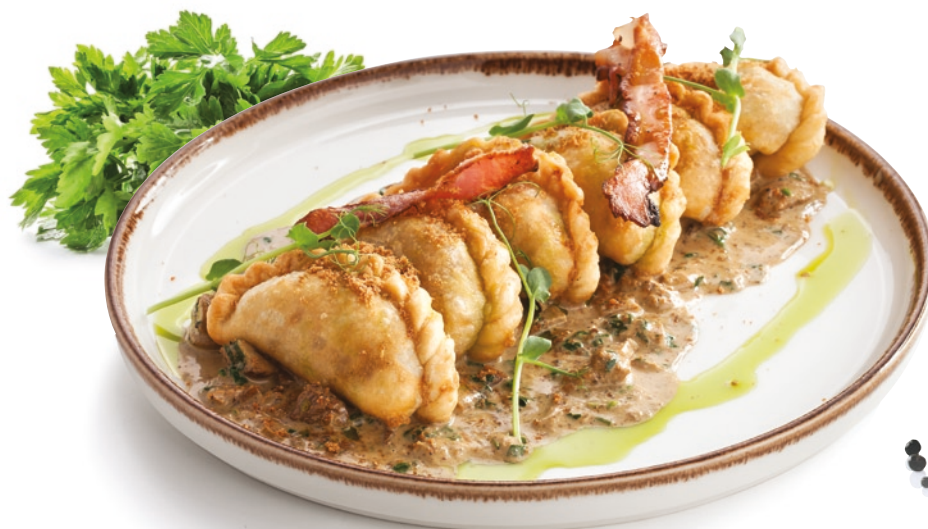
..ykład podania / Serving example