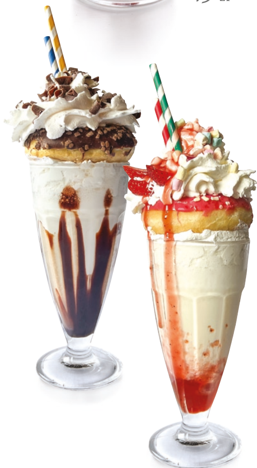
SHAKE SHAKE 380ml 39 zł