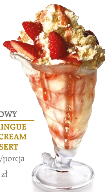
BEZOWY MERINGUE ICE CREAM DESSERT 200g/porcja 44 zł