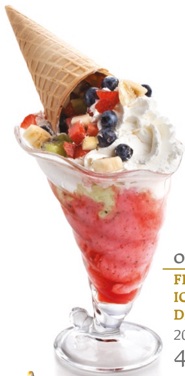
OWOCOWY FRUIT ICE CREAM DESSERT 200g/porcja 43 zł