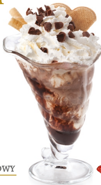
CZEKOLADOWY CHOCOLATE ICE CREAM DESSERT 200g/porcja 40 zł