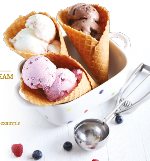
LODY ICE CREAM 80g 10 zł