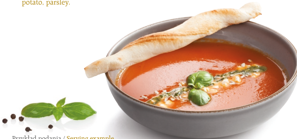
Przykład podania / Serving example