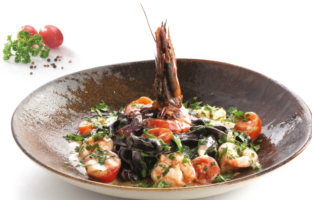
Przykład podania / Serving example